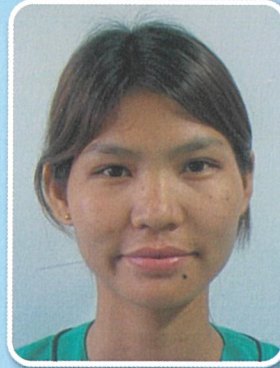
セン セン ヌ SAN SAN NU 配属部署: 3病棟